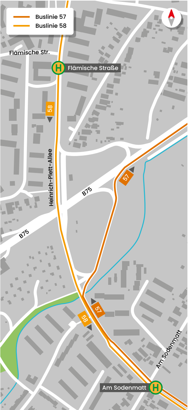
Umleitung der Buslinie 57 über die B75