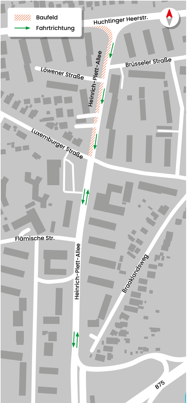
Verkehrsführung für Pkw